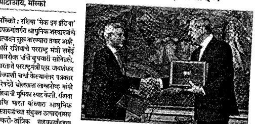
यूएनएसीच्या स्थायी सदस्यत्वासाठी रशियाचा भारताला पाठिंबे

जयशंकर यांच्या भेटीनंतर रशियाचे परराष्ट्रमंत्री लावरोव्ह यांचे प्रतिपादन